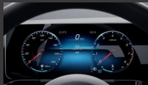
Widescreen cockpit (458)