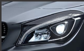
Phares LED hautes performance (632)